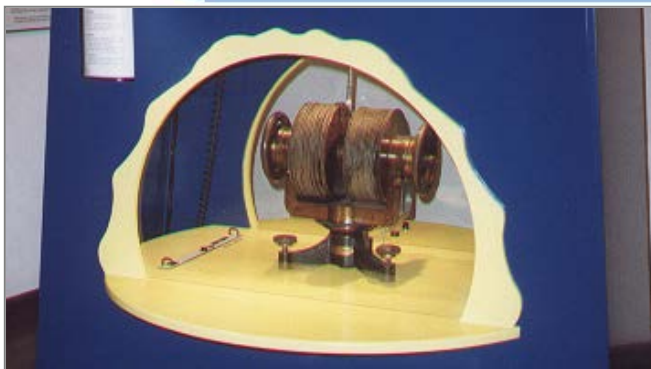
Electroimán de Blas Cabrera. Museo de Ciencia y Técnica. Centro Científico-cultural Blas Cabrera.1995.2004.